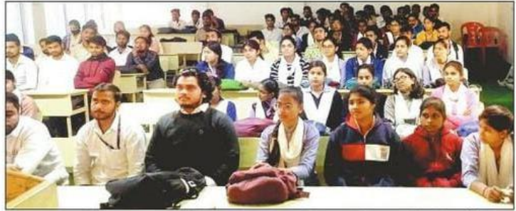
कमला नेहरू भौतिक एवं सामाजिक विज्ञान संस्थान में आयोजित कार्यक्रम में शामिल विद्यार्थी।