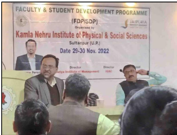
Ratan Pur, Uttar Pradesh, India 73QJ+Q5G, Ratan Pur, Uttar Pradesh 228118, India Lat 26.289415° Long 82.080182° 30/11/22 02:30 PM GMT +05:30