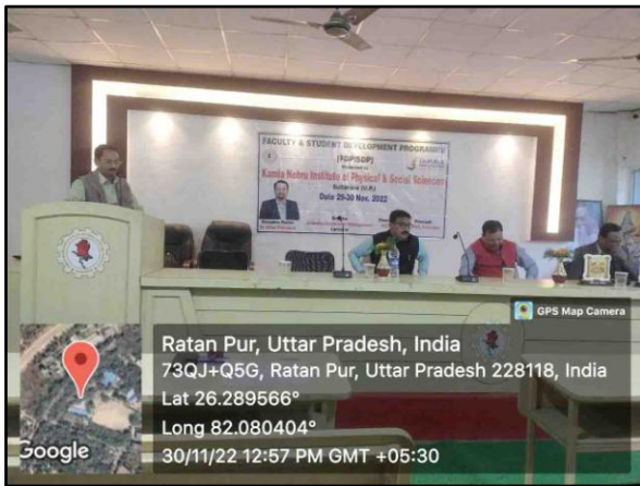
Ratan Pur, Uttar Pradesh, India 73QJ+Q5G, Ratan Pur, Uttar Pradesh 228118, India Lat 26.289566° Long 82.080404° 30/11/22 12:57 PM GMT +05:30