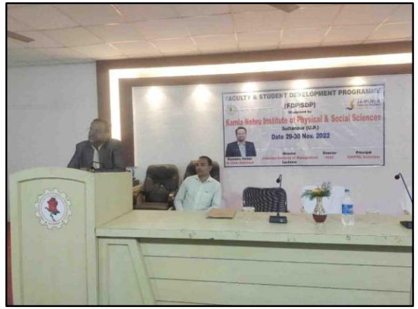
Ratan Pur, Uttar Pradesh, India 73QJ+Q5G, Ratan Pur, Uttar Pradesh 228118, India Lat 26.289416° Long 82.080283° 30/11/22 12:29 PM GMT +05:30