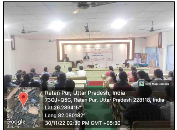
Ratan Pur, Uttar Pradesh, India 73QJ+Q5G, Ratan Pur, Uttar Pradesh 228118, India Lat 26.289415° Long 82.080182° 30/11/22 02:30 PM GMT +05:30