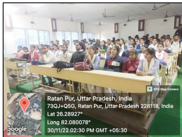
Ratan Pur, Uttar Pradesh, India 73QJ+Q5G, Ratan Pur, Uttar Pradesh 228118, India Lat 26.28927° Long 82.080078° 30/11/22 02:30 PM GMT +05:30