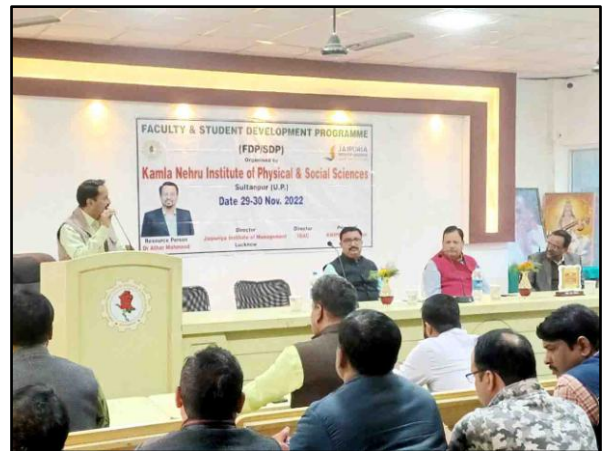
Ratan Pur, Uttar Pradesh, India 73QJ+Q5G, Ratan Pur, Uttar Pradesh 228118, India Lat 26.289415° Long 82.080182° 30/11/22 02:30 PM GMT +05:30