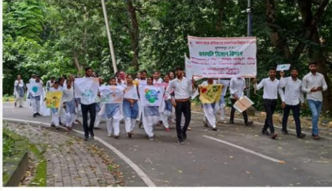
संवाददाता संतोष पाण्डेय

ओज़ोन दिवस के उपलक्ष्य में दिनांक 16 सितंबर 2023 को कमला नेहरू भौतिक एवं सामाजिक विज्ञान संस्थान सुल्तानपुर के वनस्पति विभाग द्वारा एक जागरूकता रैली निकाली गई। जिसमें पास के मोहल्ले में रहने वाले लोगों को ओज़ोन परत के छरण को कम करने हेतु उपाय बताए