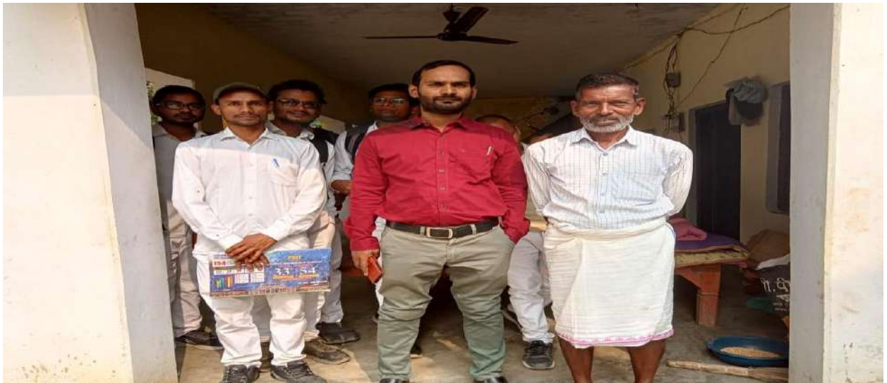
Community Programme : B.Ed.–I Sem. , M.Ed. I Sem. 20/11/2023